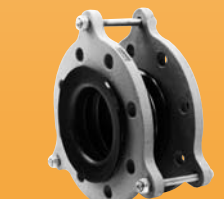
kompensatory teflonowe (PTFE)