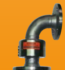
przeguby obrotowe rurowe